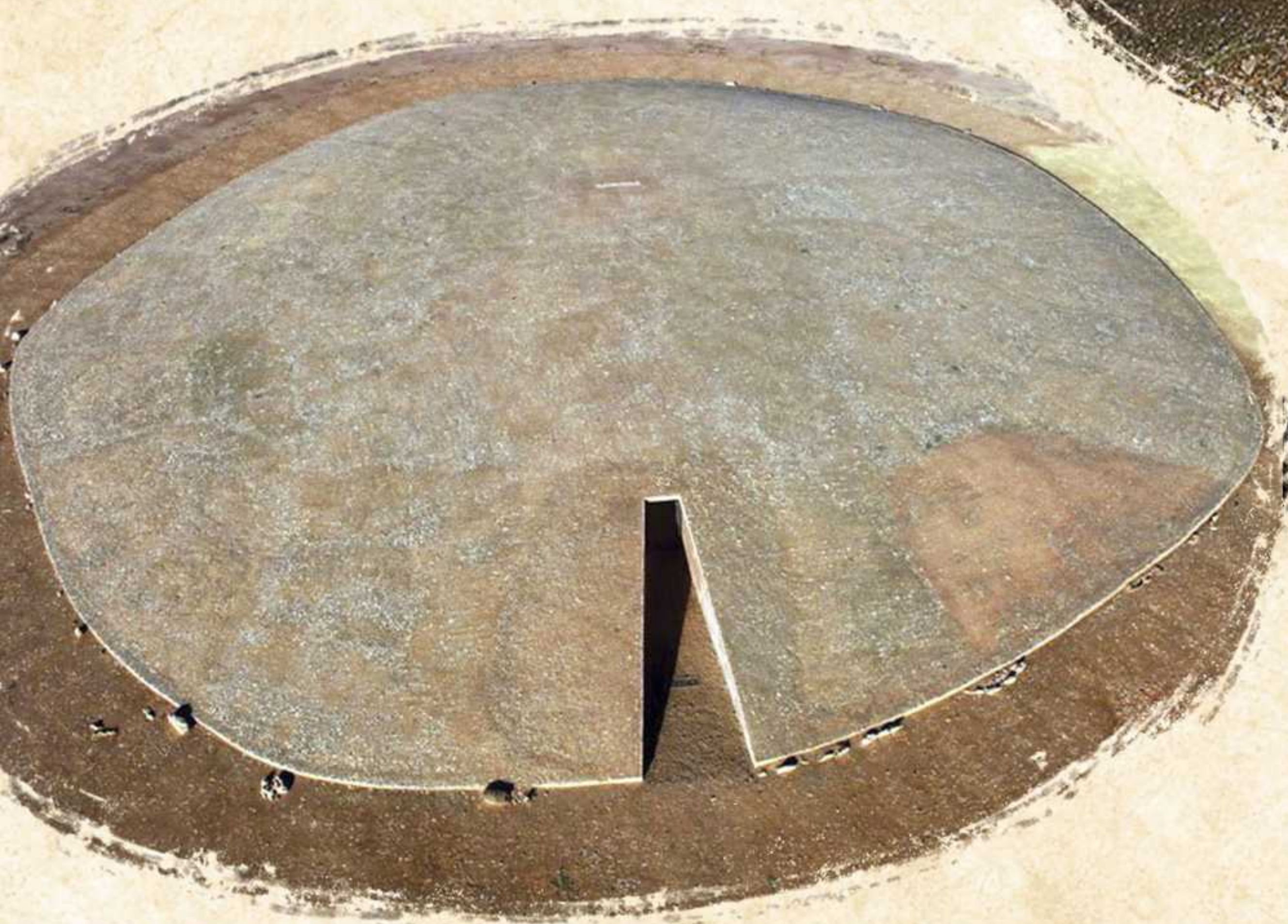
Dolmen de Soto