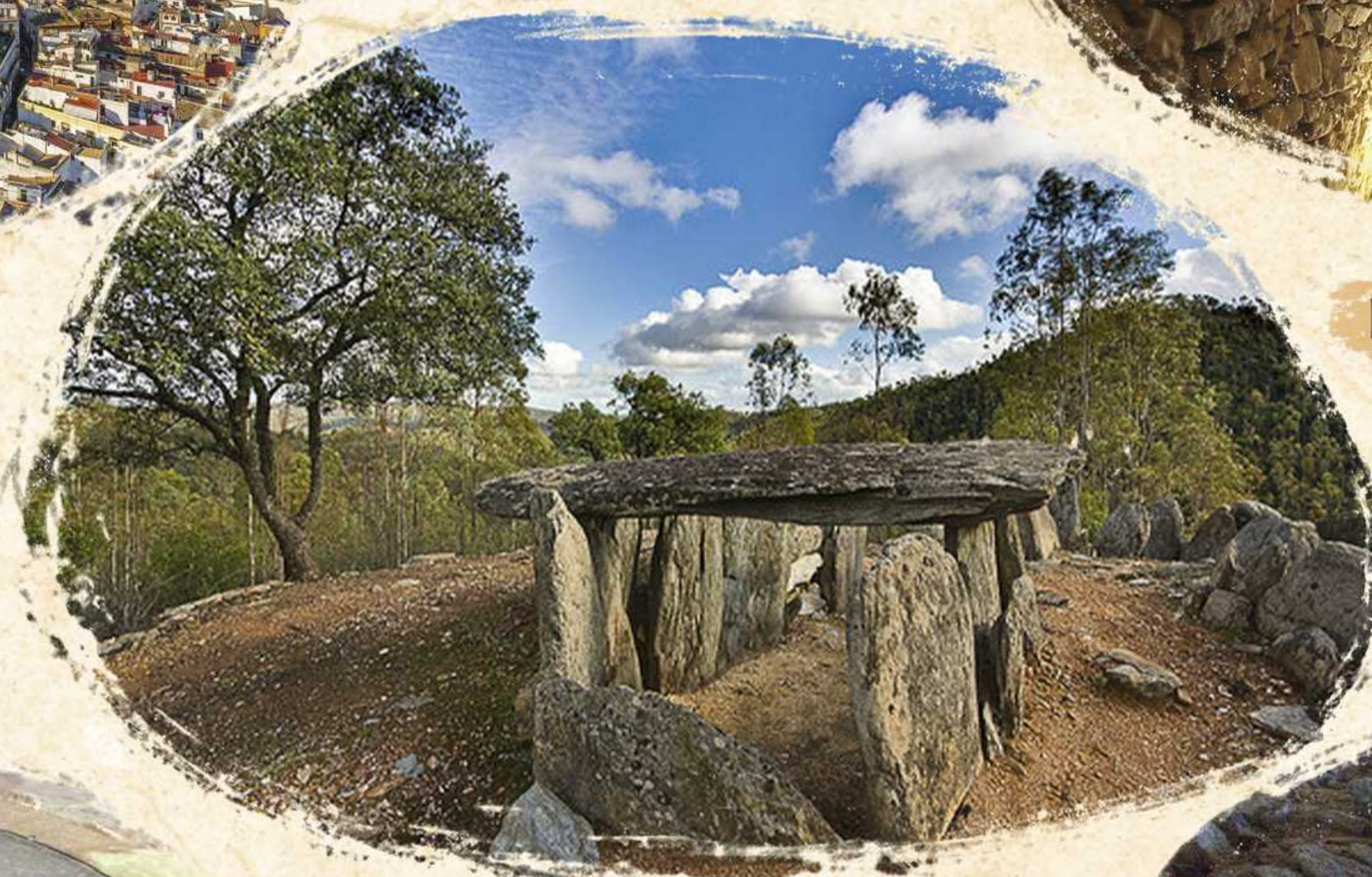
Dólmenes de El Pozuelo