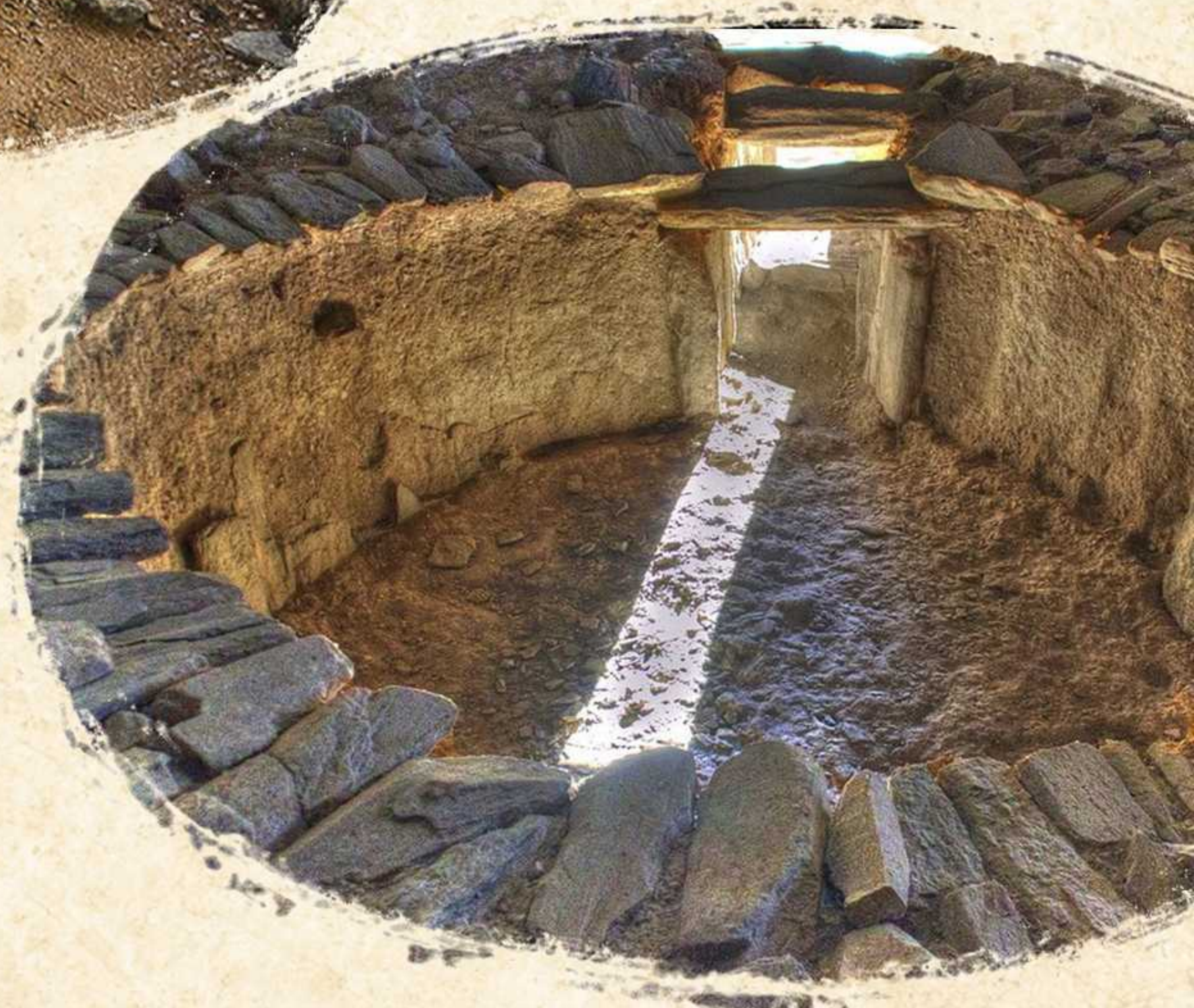
Sepulcro Huerta Montero