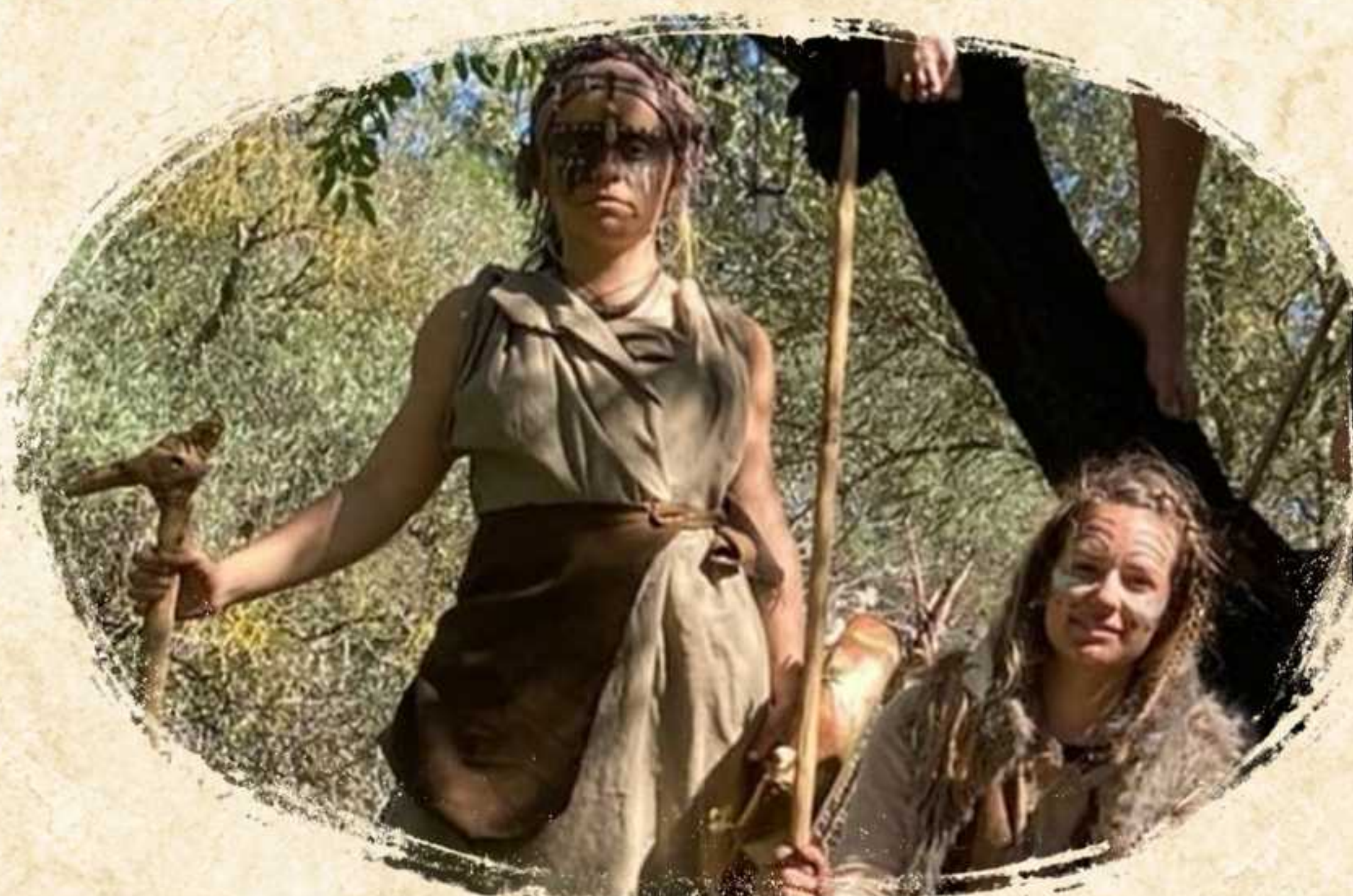
MAYAHUÉ Y MALANA