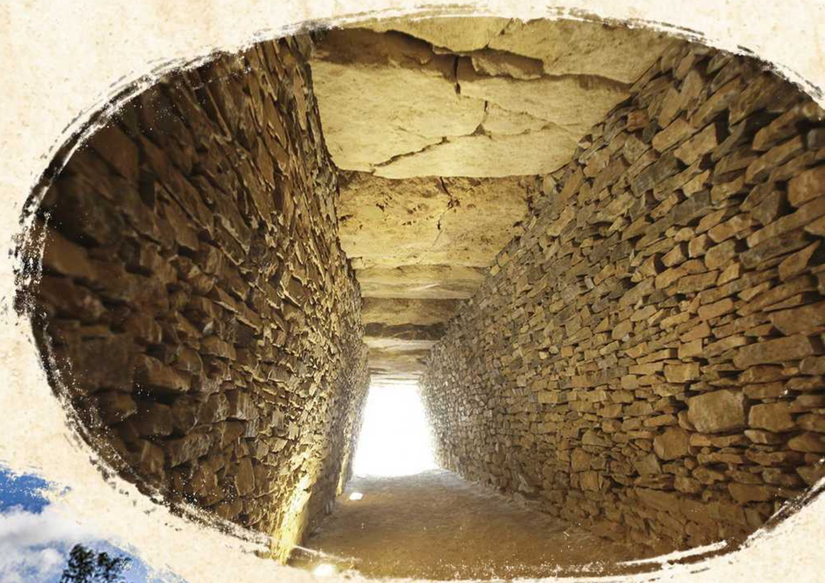
Dolmen de La Pastora